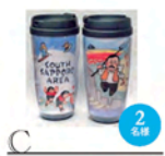
C 東海大学学生&工藤アルティマコが企画「South Sapporo タンブラー」 1個1,200円(税込)

春夏！木箱入りのカステラです！しっとり、柔かたで、甘いものが苦手な人でも、ばくばくと食が進んでしまいます。素材と味のよさは太鼓判です！提供/スイーツギャラリー北じま