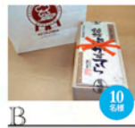
B 塩かすてら 1,260円(税込)

「野生生物と交通」研究発表会の開催10回を記念してオリジナルTシャツを制作しました。ディーパーブル(紫・パーガンディ(えんじ)・グレー)の3色。