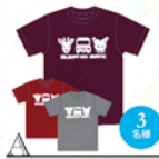
A 野生生物と交通 オリジナルTシャツ 各色1名(Lサイズ)1,800円(税込)

真鍮園にすんでいるエリスを型取ったオリジナルクッキー。厳選素材を使用した手作り。ミニクッキーはエリスの大好きな木の実付き。提供/真鍮産直(製造:広尾町今村菓子店)