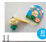
H あつもんストラップ 非売品

「野生生物と交通」研究発表会の開催10回を記念して、野生動物のイラストがかわいいオリジナルマグカップを制作しました。