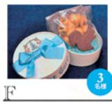
F オリジナルりす型クッキー 500円

フレッシュ野菜や温野菜、カルパッチョに合わせる美味しさ倍増！フレンチドレッシング「オランジュ」の産地雄ニシエプロデュースのドレッシングを商品化。