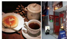
「フランスあんぱんバター焼きセット」(530円)はテイクアウトもできる。網走駅からすぐの店舗は1975年創業