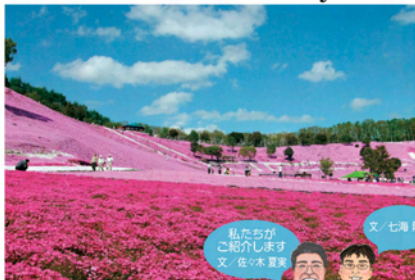
私たちが ご紹介します 文/佐々木夏実