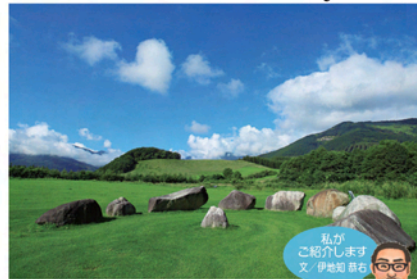
アイヌの伝承を表現した巨石によるランドアート

千年という単位で ものごとを考える。 自然との真の共生を考える。 そんな壮大で 大切なテーマで営まれる 森。があるのです。