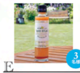
E 十勝あずき純粋酢使用「フレンチドレッシング」 680円(税込)

アンケートにご協力いただいた方の中から抽選で 41名 にプレゼントを差し上げます。