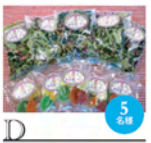
D 紫竹ガーデンオリジナルハーブティー&ハーバルフルーツティー 1セット約1,000円(税込)

札幌南エリアの名所と名物をいれ込んだかわいいイラストのタンブラー。春夏/秋冬バージョンがあり、入れ替え自由。提供/東海大学地域連携研究グループ(SAN)