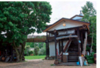
階段を登ればティールーム

搾りたての牛乳を使った自家製チーズが自慢のお店。2階のティールームでんびりお茶するのもいいですし、外でソフトクリームを食べるのもいいですね。いち押しチーズは「チーズの味増濃け」です！ 📍 広尾郡大樹町下大樹198 ☎ 01558-6-3182 🕒 水～日曜日 11:00～18:00 休 月曜日、火曜日 📞 396 049 124*00 🚗🚚🚗🚚🚗🚚