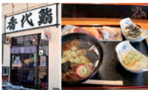
常連さんも飽きさせない「ランチセット」が人気です！国道391号のガランスタンド(中島商店)の前です

☎ 網走市新町2-2-6 ☎ 0152-44-1095 営業 10:00~15:00, 17:00~22:00 (LO 21:30) 休 毎週水曜 ☎ 305 676 153*66 📍🚗🚶🚶🚶