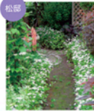
季節に応じた花々の小径