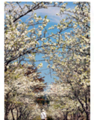
大切に育てられたスモモの木。真っ白な花は桜とはまた違ったかわいらしさ

すももの里 ① 〒 河西郡更別村字更別南5線96-1 ☎ 0155-52-2115(更別村役場 産業課) 🕒 5月中旬～下旬の日中(夜間照明なし) 📞 396 489 472*42 🚗🚚🚗🚚🚗🚚