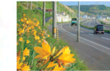
小平町の沿道に咲くエゾカンゾウ

萌える天北オロコルートが春が過ぎ、いよいよ夏到来という6月中旬にかけて、沿道に咲き乱れるエゾカンゾウ。小平町周辺では種取り、苗づくり、植栽の一連の活動を行っているほか、金浦原生花園(遠別町一地区)や鏡沼海浜公園(天塩町一地区)、幌延ビジターセンター(幌延町一地区)で鑑賞できます。