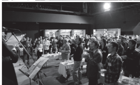
SBWフォーラム2007の懇親会の様子(2007年6月2日)

して同志としての応援を兼ねた何かを形にしたいという想いで、ルート的情景を歌い繋ぐ曲の制作を、誰に頼まれたわけでもなく勝手に始めたのでした。