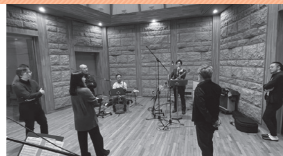
芸森スタジオでの収録の様子(2023年1月8日)

に、包括的に全体を歌う通称「ゼロ番」の歌詞制作に着手してくれました。自分にとっても初めてとなる他者の手による作詞です。みんなで検討を重ねていただき、素晴らしい「ゼロ番」の歌詞が完成しました。