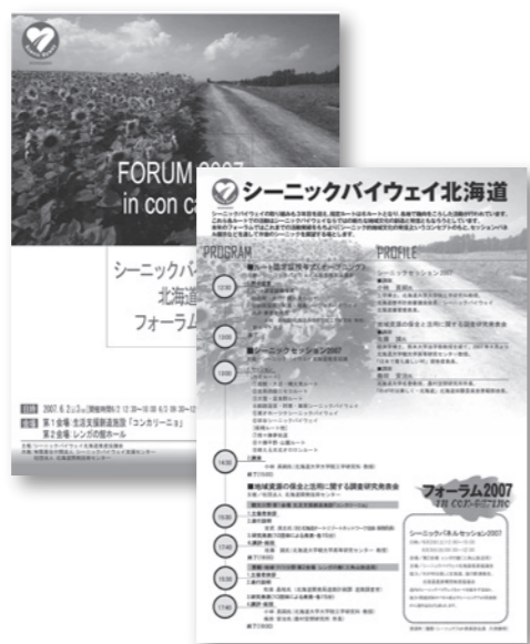
シーニックバイウェイ北海道フォーラム2007の案内チラシ

私事ですが、自分は浪人、留年、休学、修士進学と、凶らずも退学以外を軒並み経験しており、長いバブル期を全て学生という立場で送りながら、しがたないギタリストとして音楽や演劇等に携わっていました。当時の好景気はビジネスシーンにとどまることなく、音楽シーンでは演奏の仕事が数多くあり、演劇シーンも80年代半ばの小劇場ブームとも