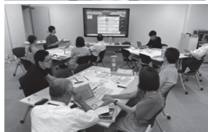
「ゼロ番」制作のための打合せの様子(2024年7月24日)